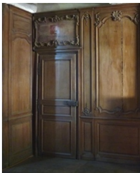
Boiserie du salon

- œuvrer à la mise en valeur du "Logis seigneurial" de l'ancien château de Lisle, par des activités culturelles, artistiques et éducatives. Ces activités peuvent être réalisées, seul ou en partenariat avec d'autres Associations ou Collectivités.