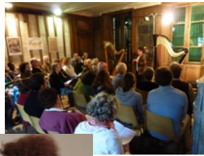
Récital de harpe