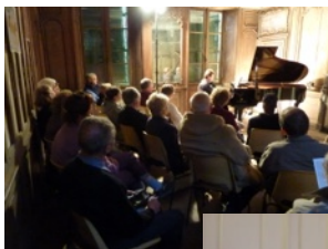
Piano à quatre mains

Les dossiers qu'elle a réalisés pour la Journée du Patrimoine de Pays le 19 juin 2011 ayant pour thème "Le patrimoine caché" et faisant découvrir la chapelle Saint-Hilaire et l'église, ont permis à la Commune de présenter une demande de subvention auprès de la Fondation du Patrimoine pour la restauration du maître-autel (1778), rare témoin mobilier provenant de l'abbaye de Jeand'heurs.