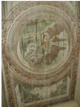
Le plafond peint

La notoriété du Logis Seigneurial s'étend dans un rayon de 150 kms et depuis son ouverture au public en juillet 2009, plus de 1200 visiteurs ont déjà découvert son exceptionnel décor XVIIIe et son rare plafond peint ainsi que son intéressante histoire. Les artistes invités et les auditeurs apprécient l'excellente acoustique du salon et son atmosphère intime.